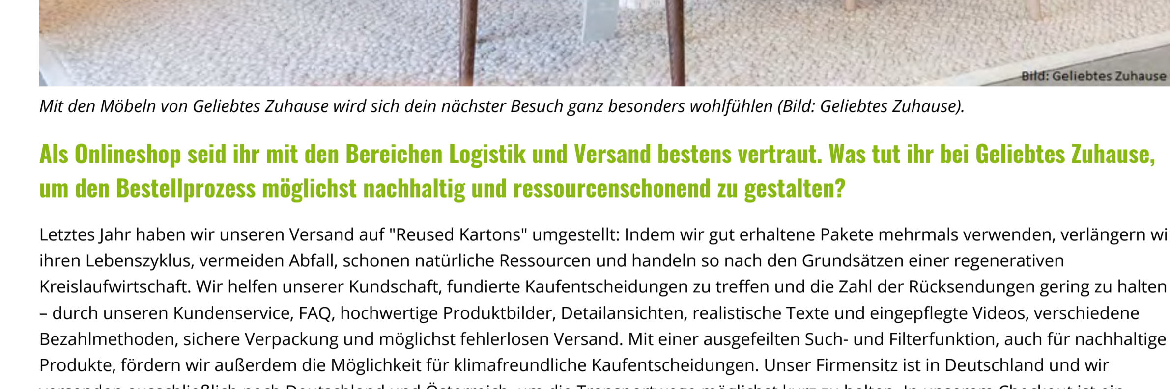
Mit den Möbeln von Geliebtes Zuhause wird sich dein nächster Besuch ganz besonders wohlfühlen (Bild: Geliebtes Zuhause).

Auch bei schöner Inneneinrichtung gibt es viele Möglichkeiten, Rohstoffe zu schonen und unseren ökologischen Fußabdruck zu verringern. Wichtig ist, überhaupt anzufangen, denn Millionen kleiner Schritte machen den Unterschied. Wir können z. B. Möbel aus heimischen Hölzern und aus Paulownia oder Bambus nutzen, denn mit ihrem schnellen Wuchs und der hohen CO2-Speicherkapazität sind sie wichtige Werkstoffe für die nachhaltige Holzproduktion der Zukunft. Müll vermeidet beispielsweise auch unser Carbonator, mit dem wir Leitungswasser aufbereiten, statt Plastikflaschen zu kaufen und Wasserkränen zu transportieren. Den großen Hebel sehen wir darin, nachhaltige Produkte lange zu verwenden, zur weiteren Nutzung zu verschenken oder zu upcycle. Bei unserer Marke Loops z. B. wird aus einer Duftkerze eine Vorratsdose.