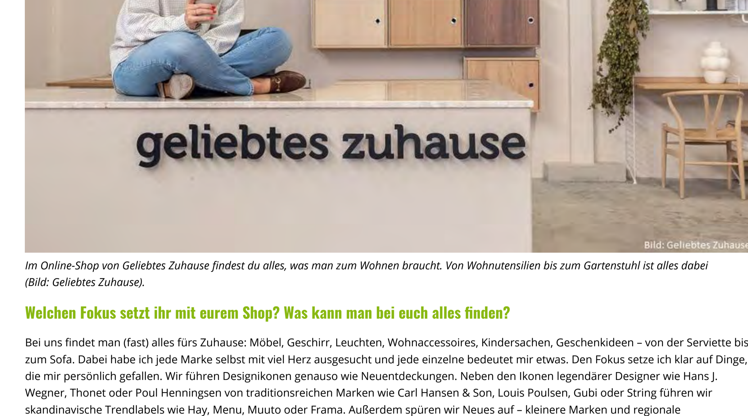
Im Online-Shop von Geliebtes Zuhause findest du alles, was man zum Wohnen braucht. Von Wohnstühlen bis zum Gartenstuhl ist alles dabei.

Der nordische Wohnstil steht für klare Linien, natürliche Materialien, schlichte Formen, hohe Qualität und oft neutrale Farben. Er vereint Funktionalität mit Ästhetik und lässt eine ruhige Wohnatmosphäre entstehen. Beim skandinavischen Design geht es also darum, die Schönheit der Natur und das Alltägliche zu feiern. Es ist auch deshalb auf der ganzen Welt so beliebt, weil es zu einem minimalistischen und natürlichen Lebensstil einlädt. Nordic Design lässt uns Räume schaffen, in denen wir uns geborgen und zu Hause fühlen. Oasen der Ruhe und Entspannung. Stellen wir uns zum Beispiel ein skandinavisches Ferienhaus vor, so duftet es nach Holzbohlen, wir sind umgeben von weichen Textilien und warmem Licht. Die Landschaft ist vielleicht eine Mischung aus wilden Wäldern und weiten Ebenen. Oder aus spektakulären Horizonten und klarem Wasser, in dem sich atemberaubende Fjorde spiegeln. In jedem Fall spüren wir diese besonderen Orte voller Ästhetik, die uns inspirieren, uns mit der Natur zu verbinden.